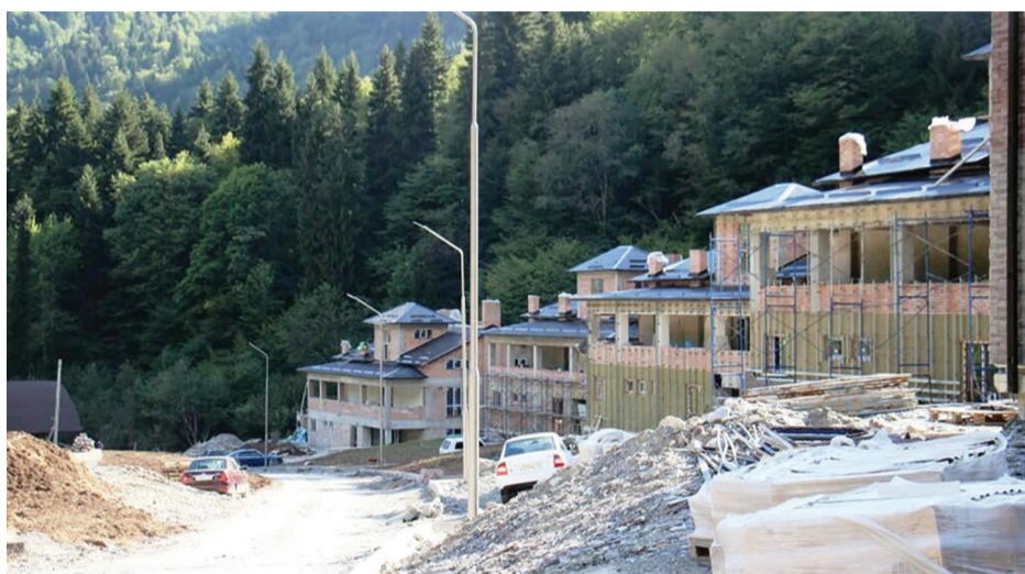
Строительство детского лагеря в Мзиугом