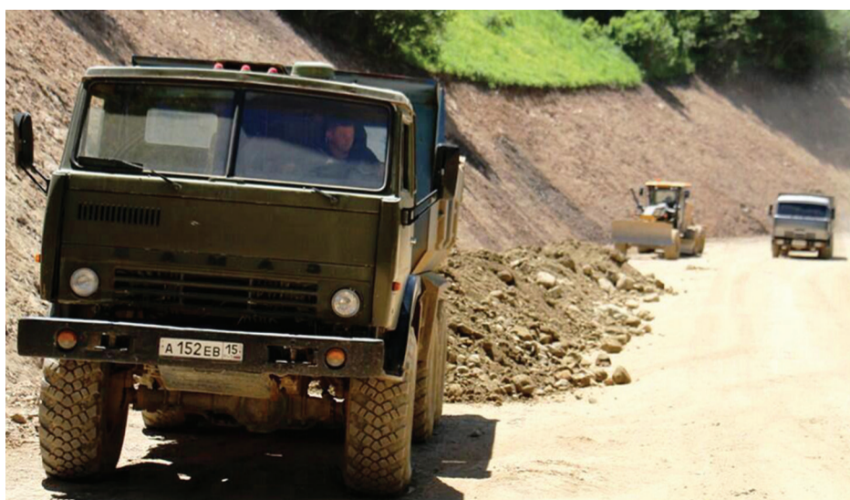
Строительство дороги «Эрцо–Синагур»